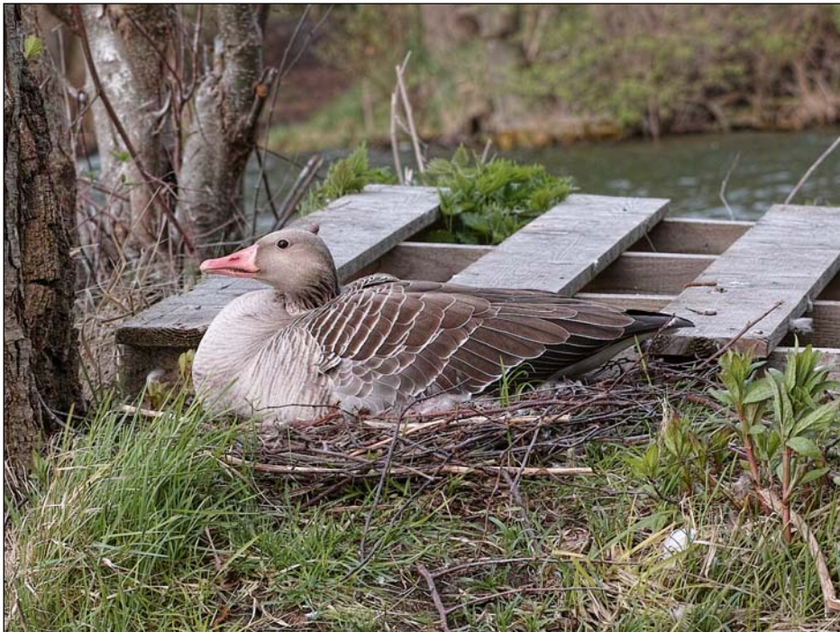
Graugans bei Kleinbeuthen